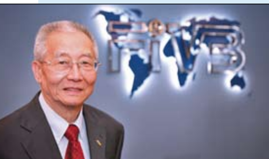
M. Jizhong Wei, Président de la FIVB

Lorsqu'il s'agit de travailler ensemble, de se développer ou de croître comme une équipe, que ce soit sur un terrain de Volleyball ou dans la salle du Conseil d'administration, la communication joue un rôle vital – qui ne saurait être unidirectionnel. La circulation des informations et des idées doit impérativement se faire dans les deux sens; telle est précisément la raison du dernier changement apporté au bulletin World Volley News, où chaque Confédération de la FIVB dispose désormais d'une demi page pour faire connaître ses activités et les dernières actualités la concernant.