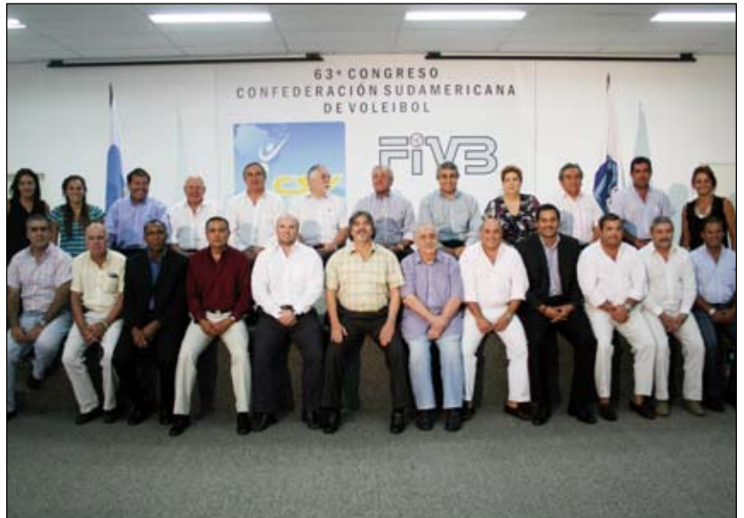
A l'occasion de son Congrès annuel, la CSV a lancé deux nouvelles compétitions, ainsi qu'un certain nombre de projets novateurs dans le domaine de la formation

Suite à cette réunion, la CSV a décidé de travailler avec un certain nombre de Fédérations nationales en vue de leur fournir des projets de formation en Volleyball et en Beach Volleyball; il s'agit de dénicher de nouveaux talents et d'organiser des cours de formation destinés aux entraîneurs locaux. Les formateurs seront rémunérés par la Confédération.