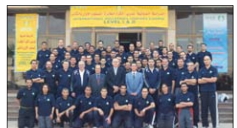
Ce mois-ci, des cours de développement ont été dispensés avec succès en Rép. dominicaine (à gauche), à Djibouti (au centre) et en Egypte (à droite)