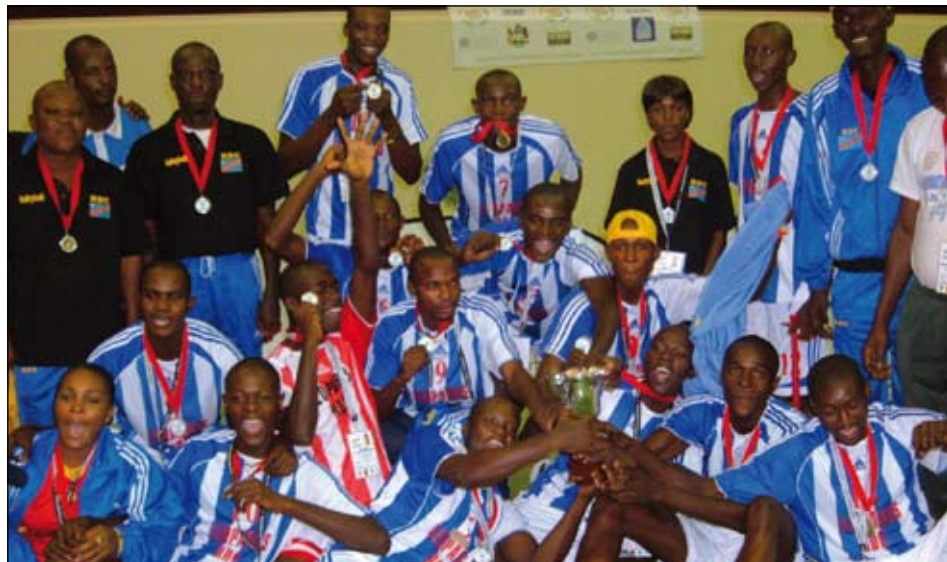
Au départ, l'équipe de la RDC n'était pas donnée favorite dans ce tournoi de qualification en vue des Jeux olympiques de la jeunesse

Par ailleurs, l'Afrique du Sud, pays hôte, a battu le Maroc par 3-2 (25-18, 19-25, 25-20, 27-29 et 15-13) lors du match final de ce tournoi.