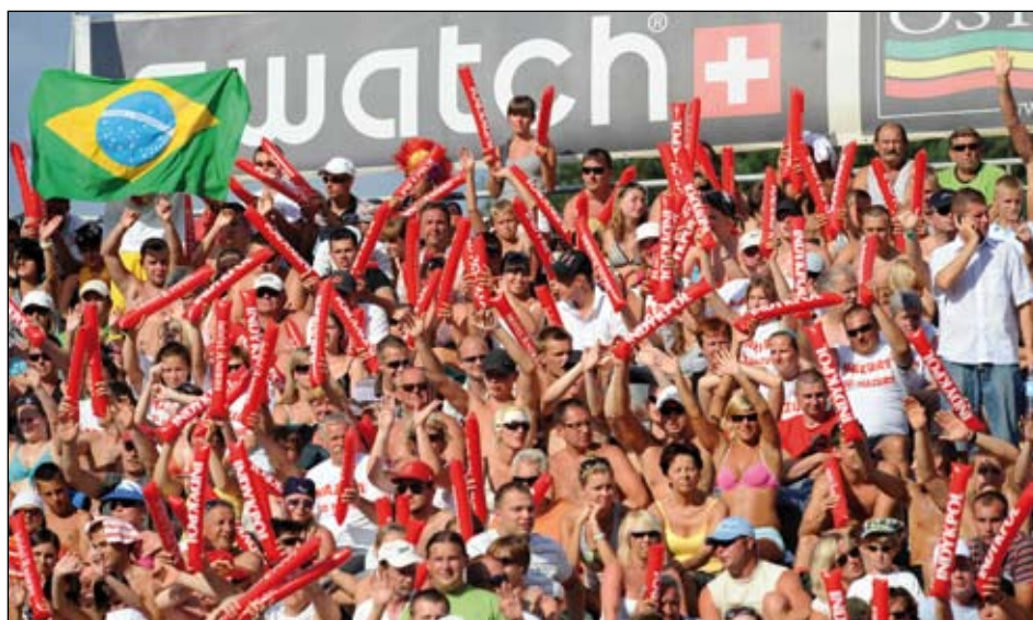
La nouvelle initiative permettra aux fans et aux joueurs amateurs de Beach Volleyball de pratiquer leur sport favori sur plusieurs sites mythiques du Circuit mondial SWATCH FIVB