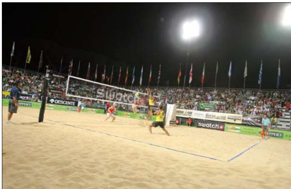
En 2009, Rome a été l'hôte d'un Open masculin du Circuit mondial SWATCH FIVB

Cette année, la capitale italienne accueillera l'un des six Grands chelems du Circuit mondial SWATCH FIVB; les autres villes hôtes seront Moscou en Russie, Stavanger en Norvège, Gstaad en Suisse, Klagenfurt en Autriche, et Stare Jablonki en Pologne.