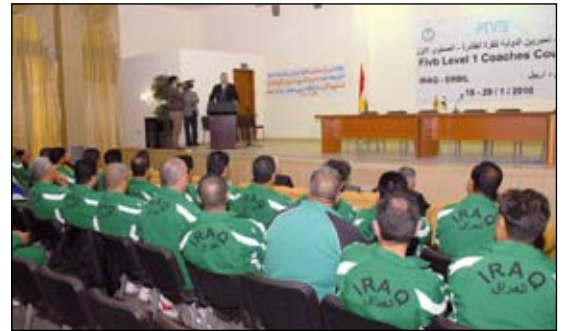
Des cours de développement de la FIVB sont organisés dans toutes les régions afin d'améliorer la qualité du jeu à travers le monde, comme ici en Irak, qui a bénéficié d'un des premiers cours PCV de l'année

Pour consulter le calendrier détaillé, visiter le site www.fivb.org .