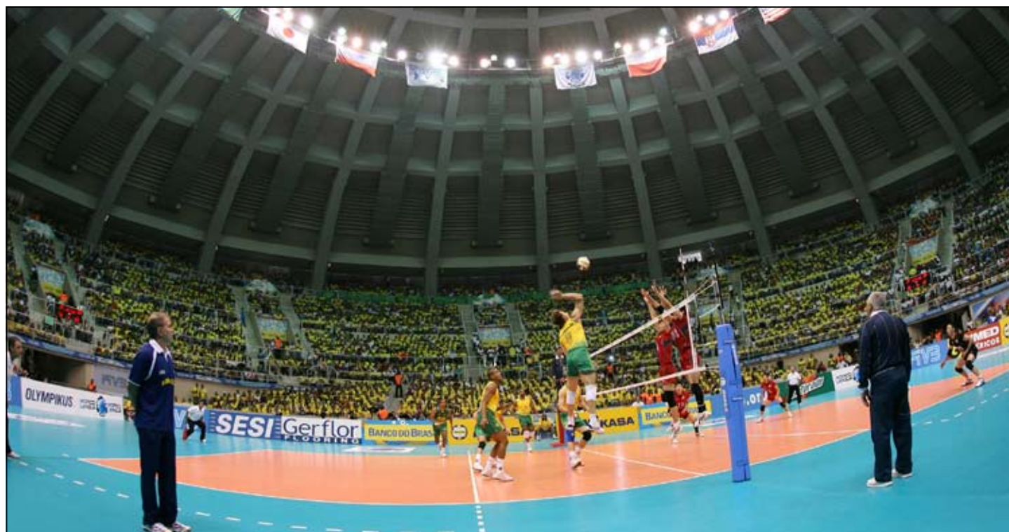
FIVB ha implementado reglas de antidopaje compatibles con WADA