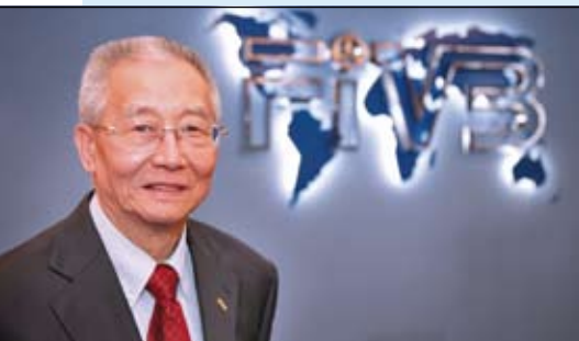
Sr. Jizhong Wei, Presidente FIVB

Con el telón a punto de caer en un año histórico para la FIVB, podemos mirar hacia atrás en 2008 con la satisfacción de grandes logros, mientras esperamos a 2009 con entusiasmo. Este último año ha sido muy atareado para la FIVB. Los Juegos Olímpicos fueron un punto focal para la mayor parte de 2008, con los eventos clasificatorios y la planificación de los torneos de Voleibol y Voleibol de Playa en Pekín que exigieron atención especial. El duro trabajo derivó en unos enormemente exitosos Juegos Olímpicos, con tres fantásticas sedes acogiendo a grandes multitudes que disfrutaron de la espectacular acción en las canchas, mientras que millones de hinchas del Voleibol y Voleibol de Playa de todo el mundo vieron el espectáculo por televisión.