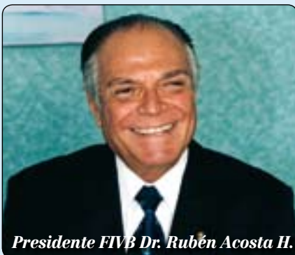
Presidente FIVB Dr. Rubén Acosta H.

Tres páginas de este World Volley News edición de abril están dedicadas