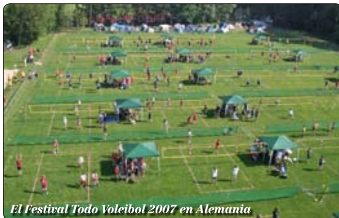
El Festival Todo Voleibol 2007 en Alemania

El Festival Voleibol para Todos proporciona una oportunidad a cada Federación de