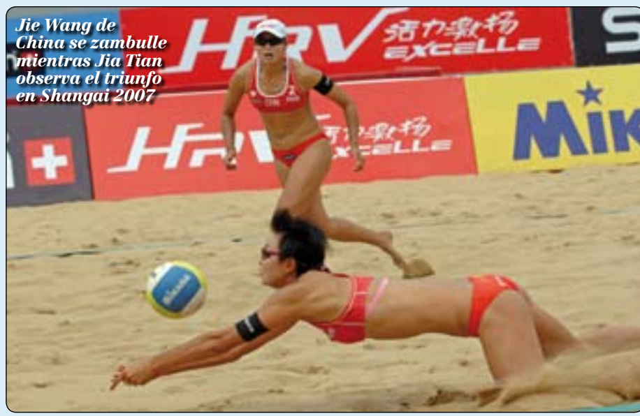
Jie Wang de China se zambulle mientras Jia Tian observa el triunfo en Shangai 2007

En el Circuito Mundial SWATCH FIVB hasta Adelaida, Juliana y Larissa ganaron 21 de 24 partidos ante Talita y Renata con cuatro victorias en cinco encuentros por la medalla dorada con sus rivales brasileñas. La final marcó el partido número 35 entre brasileñas en el Circuito Mundial SWATCH FIVB desde su inicio en 1992. Igualmente, Juliana fue nombrada la Jugadora SWATCH más Sobresaliente del evento. Talita y Renata, que se repartieron los USD