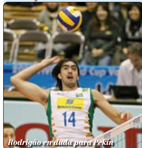
Rodrigo en duda para Pekín