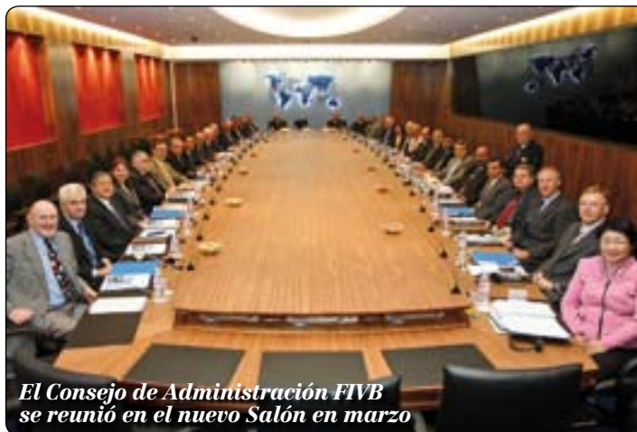
El Consejo de Administración FIVB se reunió en el nuevo Salón en marzo

El Presidente de la FIVB, Dr. Rubén Acosta, dio la bienvenida a todos los miembros a la nueva y tecnológicamente vanguardista sala de reuniones en Lausana, donde se debatieron una gama de temas incluyendo cómo aumentar el número de jugadores locales en las ligas, el exitoso control Antidopaje, el nuevo balón Mikasa para los Juegos Olímpicos y fechas y lugares de los futuros eventos.