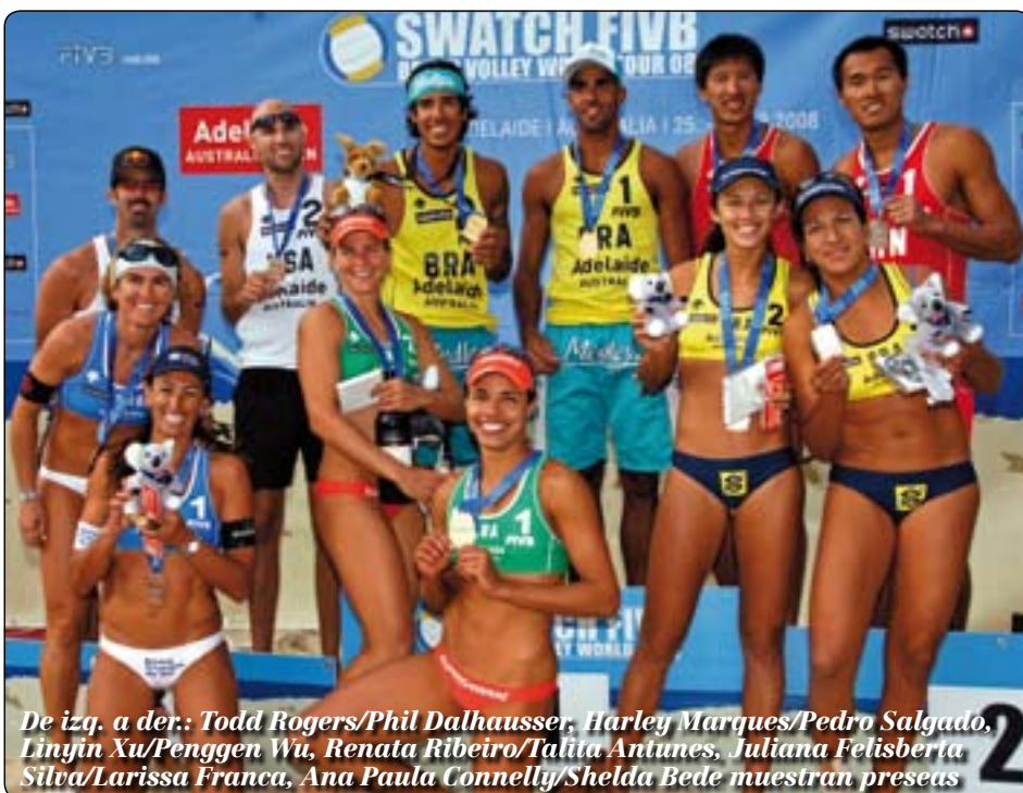
De izq. a der.: Todd Rogers/Phil Dalhausser, Harley Marques/Pedro Salgado, Linyin Xu/Penggen Wu, Renata Ribeiro/Talita Antunes, Juliana Felisberta Silva/Larissa Franca, Ana Paula Connelly/Shelda Bede muestran preseas

En el encuentro netamente norteamericano por la presea de bronce, los campeones SWATCH FIVB 2007 Phil Dalhausser