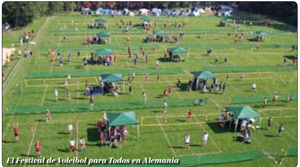
El Festival de Voleibol para Todos en Alemania

La foto de este año es del Festival de Voleibol para Todos en Alemania, la cual refleja fielmente el espíritu de cómo preparar