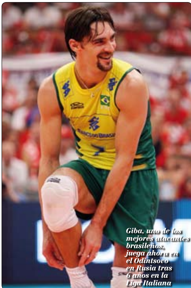
Giba, uno de los mejores atacantes brasileños, juega ahora en el Odintsovo en Rusia tras 6 años en la Liga Italiana

atletas provenientes de otras Federaciones Nacionales. Podremos ayudar al desarrollo técnico de jugadores locales en cada país si establecemos un número razonable de jugadores con certificado de transferencia. Las Federaciones Nacionales necesitan más espacio entre los 12 de cada equipo para sus propios jóvenes. Para el próximo Consejo de Administración de la FIVB tendremos esta intensa discusión, pero punto crucial para el futuro de nuestro deporte.»