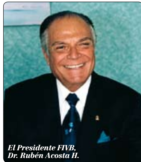
El Presidente FIVB, Dr. Rubén Acosta H.

«Estamos al inicio de un proceso de decisiones que el Consejo examinará el año entrante», dijo el Presidente de la FIVB, Dr. Rubén Acosta H. «Contar con fuertes Ligas Nacionales en cada país es parte de nuestra Visión, la cual es el desarrollo de jóvenes jugadores locales que planeamos para todas nuestras Federaciones. Son varias las naciones que ya iniciaron este proceso, pero algunas Ligas más sólidas, como la Serie A en Italia, tienen a la mayoría de sus clubes con pocos jugadores promocionados originalmente del sistema deportivo local, y demasiados