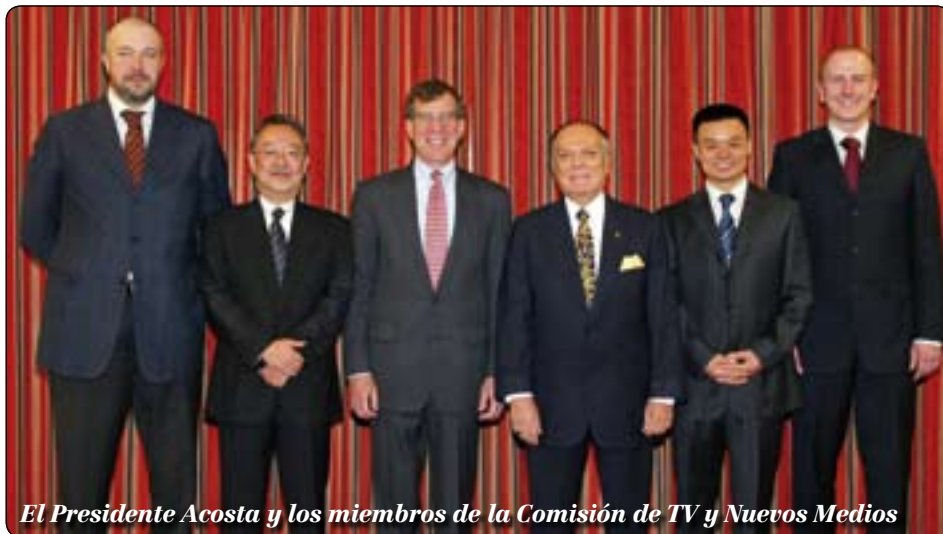
El Presidente Acosta y los miembros de la Comisión de TV y Nuevos Medios

objetivo es el de llevar el Voleibol y el Voleibol de Playa a todos los rincones del planeta.