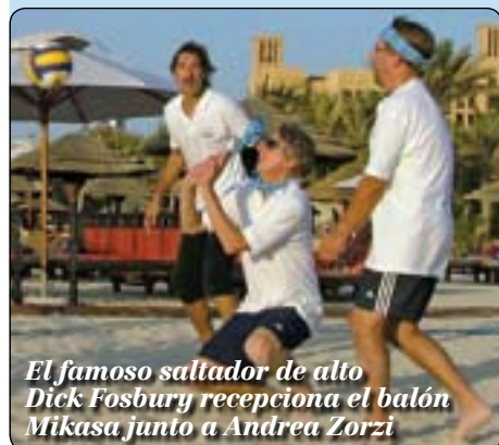
El famoso saltador de alto Dick Fosbury recepciona el balón Mikasa junto a Andrea Zorzi

Diferentes equipos encabezados por el atacante norteamericano Bob Ctvrtlik, el estelar brasileño y bicampeón olímpico Mauricio Lima y Andrea Zorzi lucharon amistosamente por este muy peculiar medalla. El garrochista Sergey Bubka, el saltador de alto Dick Fosbury (inventor del estilo Fosbury), el especialista en atletismo Hicham El Guerrouj y Frank Fredericks, el nadador Alexander Popov y muchos otros atletas mundiales usaron el Mikasa amarillo y azul para compartir sus talentos, utilizando como lenguaje deportivo en común sus aptitudes en el Voleibol de Playa.